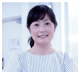
榎 茜 様 Nursing Solutions Product manager Content & Solutions Development ELSEVIER | Health Sciences